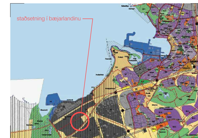
ADALSKIPULAG HAFNARFJARÐAR 2013-2025

Komi til færslu á götulögnum eða götugögnum, verði það gert á kostnað lóðarhafa.